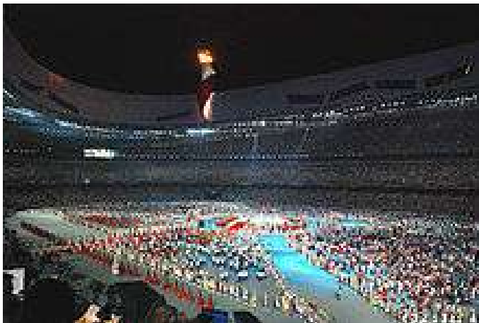
Schlussfeier der Sommerspiele 2008 in Peking